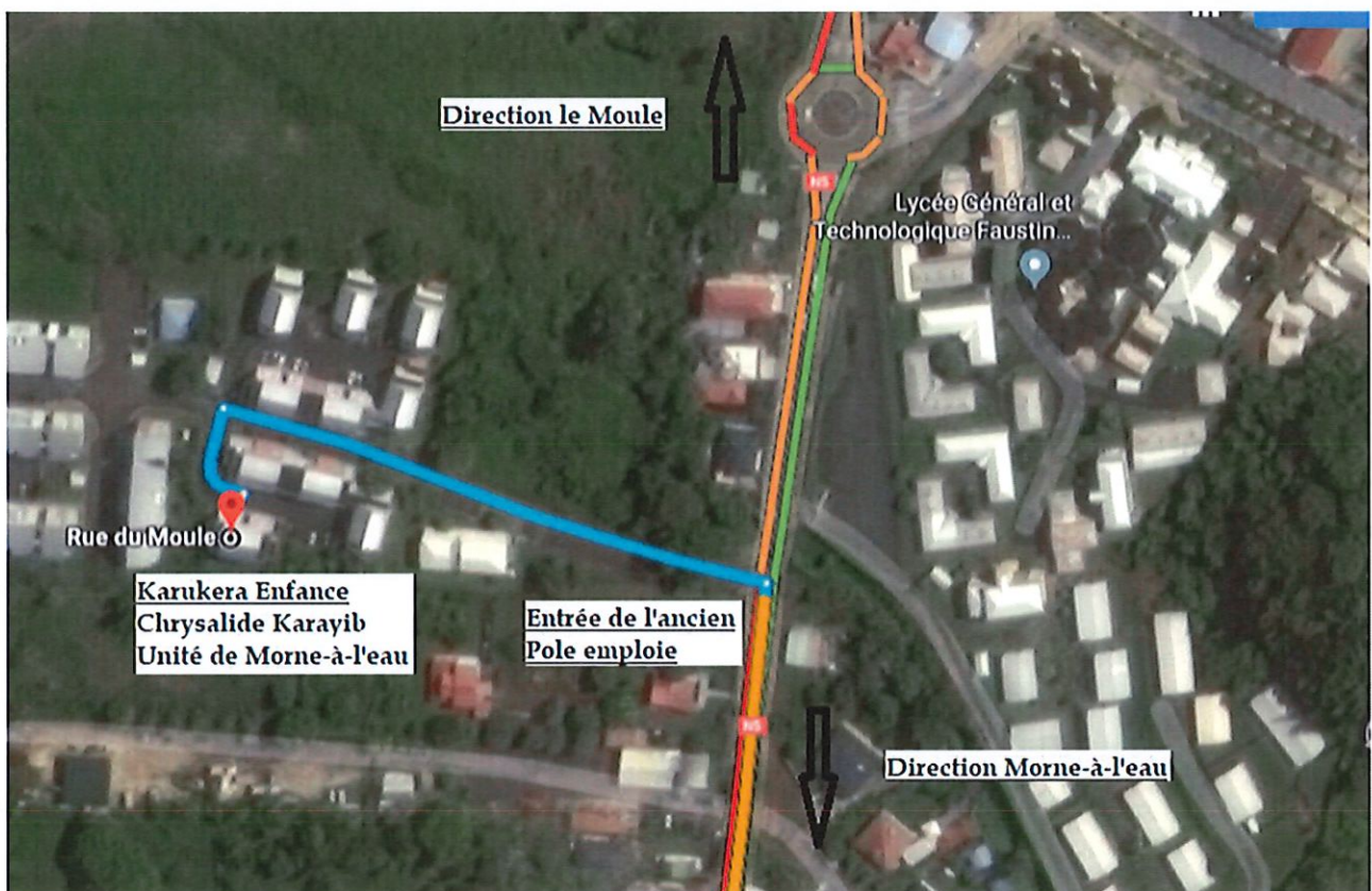
Plan D'accès de nos Locaux